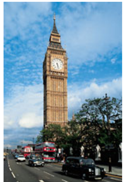
London, Big Ben